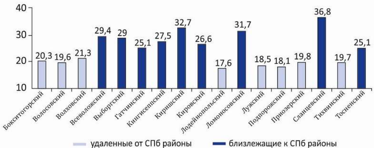
Среднемесячная номинальная начисленная заработная плата в разрезе муниципальных районов Ленинградской области.

Есть у этого процесса и свои особенности. Во-первых, строящееся загородное жилье становится в основном «вторым» жильем при сохранении в собственности квартиры в городе. Во-вторых, ведется так называемое неструктурированное строительство, что создает эффект неконтролируемого расплзания города. Третья важная особенность заключается в более низкой стоимости квадратного метра на окраинах города и в пригородах (высотной застройки), что вызывает повышенный интерес у покупателей, особенно со стороны трудовых мигрантов. Кроме того, спрос на дома в пригородных зонах связан с европейской тенденцией спроса на экологически чистое окружение и рекреацию. Во многом благодаря этому начинают активно развиваться Кудрово, Всеволожск, Янино, Бугры.